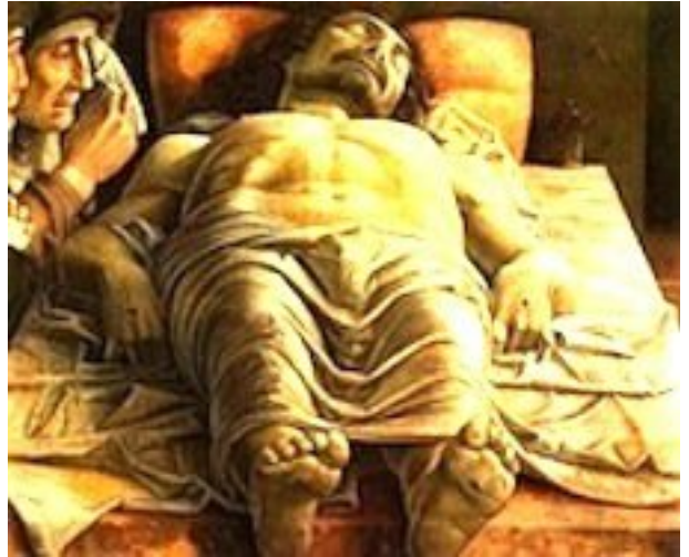
Andrea Mantegna, Le Christ mort , 1475-78, Milano, Brera.