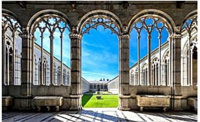
Pise, cimetière monumental.

la dispersione delle ceneri = la dispersion des cendres