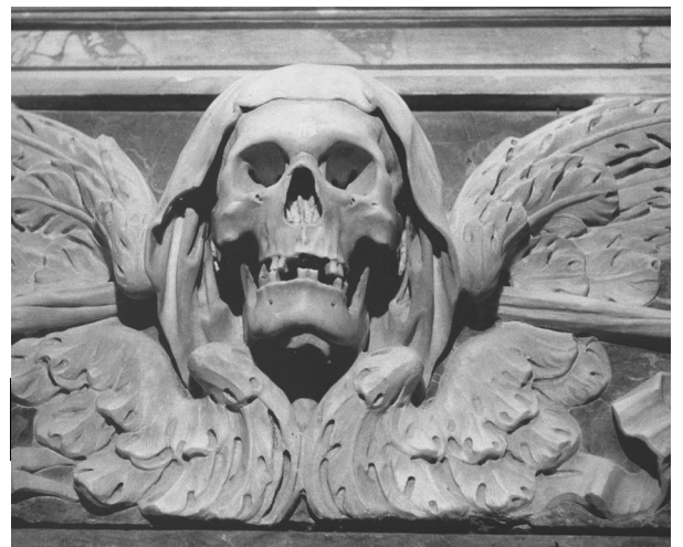
Naples, Église des Âmes du Purgatoire