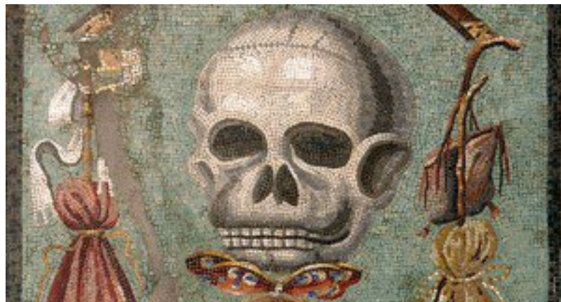
Pompei, Fresque Memento mori