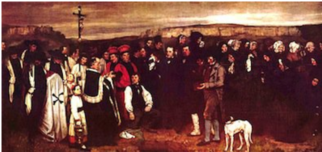
Gustave Courbet , Un enterrement à Ornans , 1849-50, Musée d'Orsay.