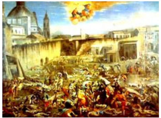
Micco Spadaro , Le Largo Mercatello durant la peste de 1656 , Musée de San Martino, Naples