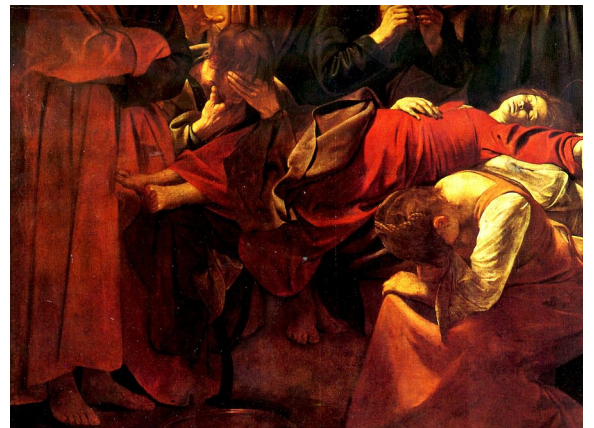
Caravaggio, Mort de la Vierge , 1605-06, Louvre (détail)