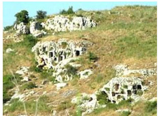
Pantalica (Sicile), Nécropole du XIIe au VIe siècle av. J.C..