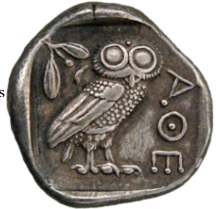
Ancien tétragramme incluant la chouette de Minerve, symbole de la philosophie à cause de sa capacité de voir dans la nuit