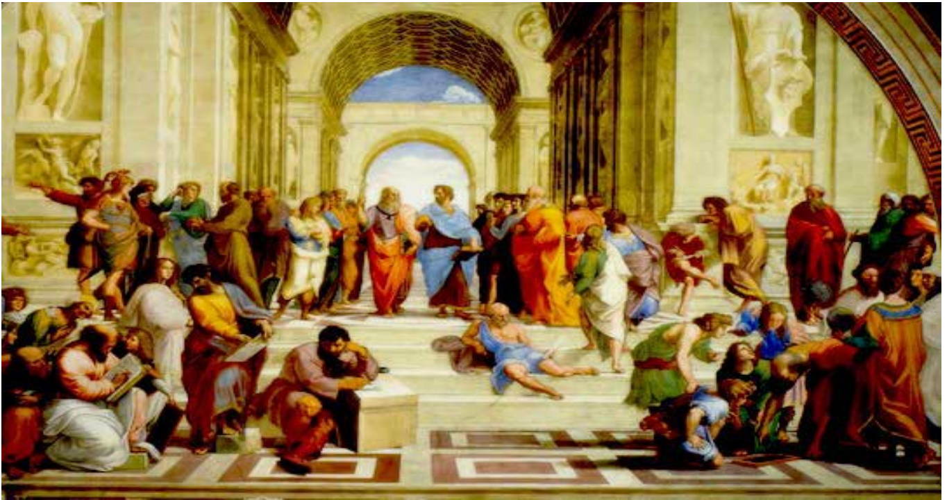
Raffaello Sanzio, L'École d'Athènes , Chambre de la Signature, Palais du Vatican, 1510

Paci Enzo (1911-1976) Vattimo Gianni (1936- ) Veca Salvatore '1941-2021) Vegetti Mario (1937-2018)