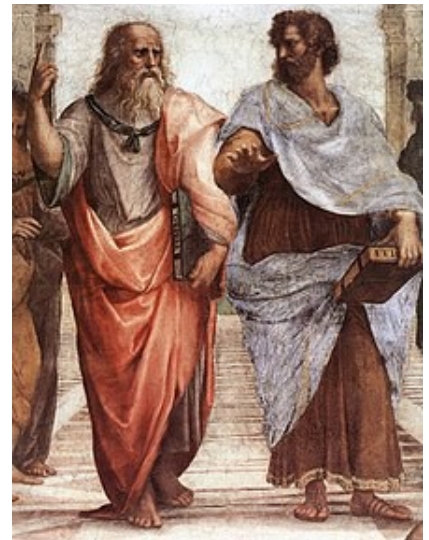
Raffaello , Platon et Aristote , Chambre de la Signature, Vatican, 1508-1512

La gnoseologia = la gnoséologie, étude du problème des origines, de la genèse des choses