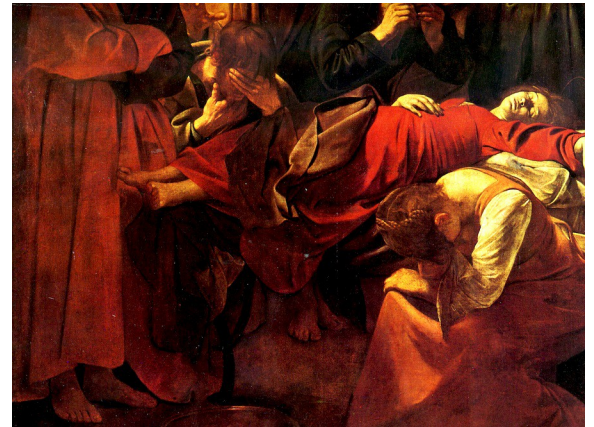
Caravaggio (Milan, 1571-Porto Ercole, 1610), Mort de la Vierge , 1605-06, Louvre (détail).