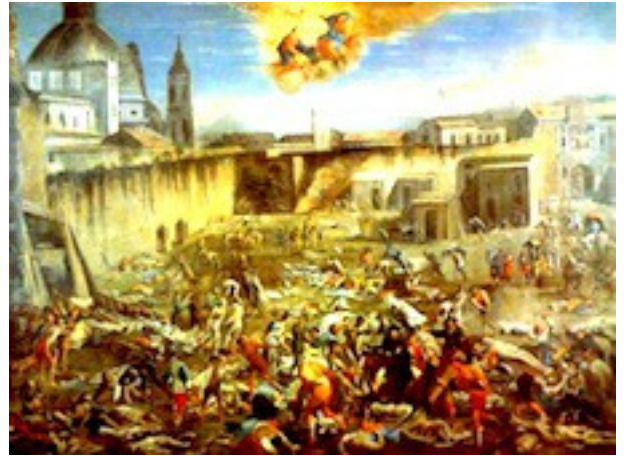
Micco Spadaro (Naples, 1609-1675), Le Largo Mercatello durant la peste de 1656 , Musée de San Martino, Naples.