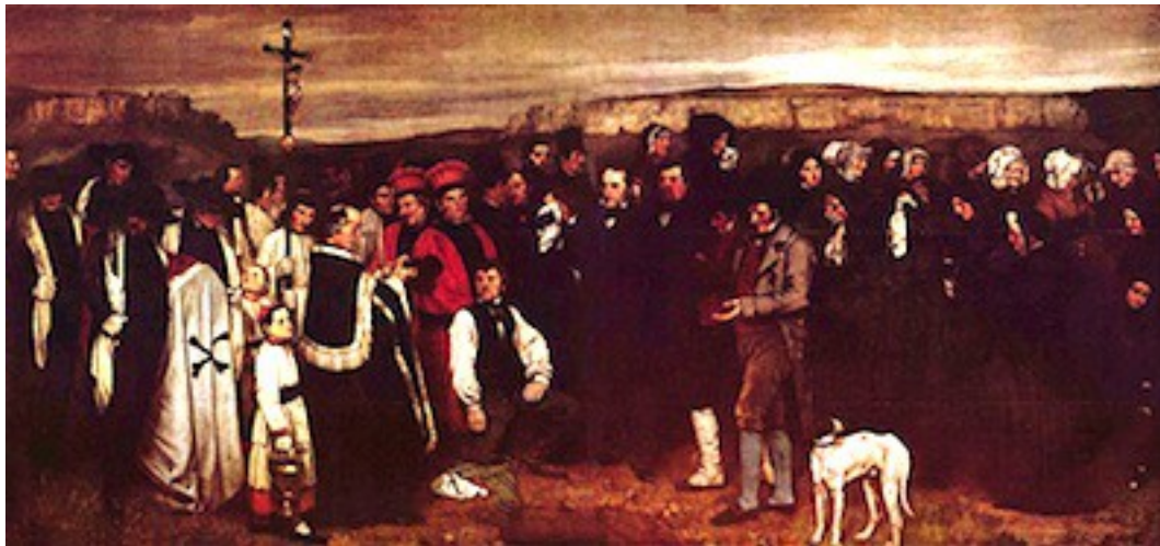
Gustave Courbet (Ornans, 1819-La Tour de Peilz, 1877), Un enterrement à Ornans - 1849-50, Musée d'Orsay.