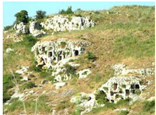
Pantalica (Sicile), Nécropole du XIIe au VIe siècle av. J.C..