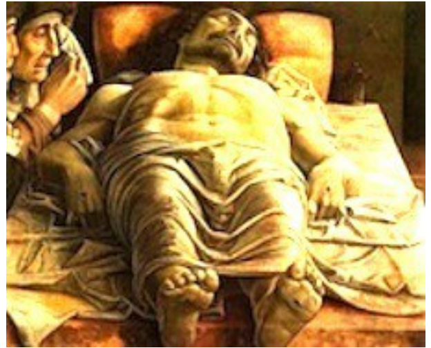
Andrea Mantegna (Isola di Carturo, 1431- Mantoue, 1506), Le Christ mort - 1475-78, Milano, Brera.

La partecipazione (l' annuncio mortuario , il necrologio ) = le faire-part