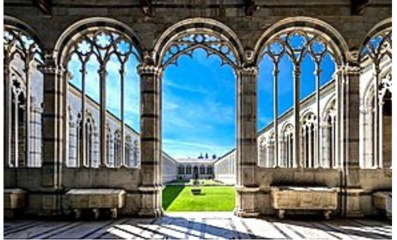
Pise, cimetière monumental.