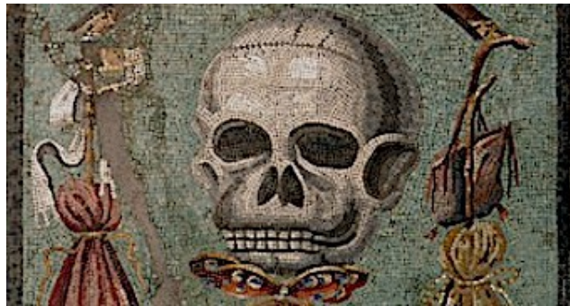
Pompei, Fresque Memento mori

10 aprile 2020 – Revu le 06 septembre 2023 (Avec mes remerciements à Roger Drémont pour sa relecture)