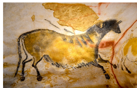
Peinture rupestre de Lascaux (au moins 17000 ans av.J.C.), Cheval.