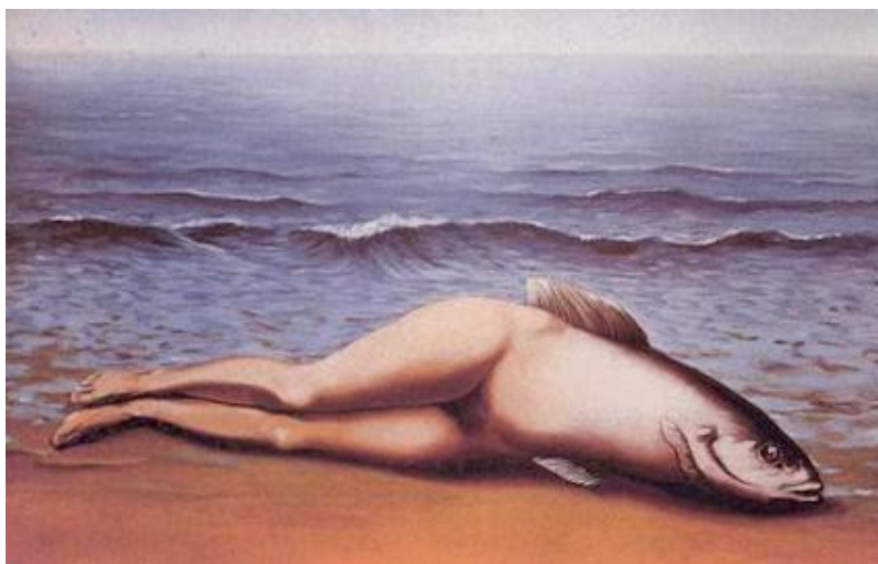
René Magritte (Lessines, 1898-Schaaerbeek, 1967), Le poisson (ou l'invention collective) - 1935, Musée René Magritte.

-0-0-0-0-0-0-0-0-0-0-0-0-0-0-0-0-0-0-0-0-0-0-0-0-0-0-0-0-0-0-0-0-