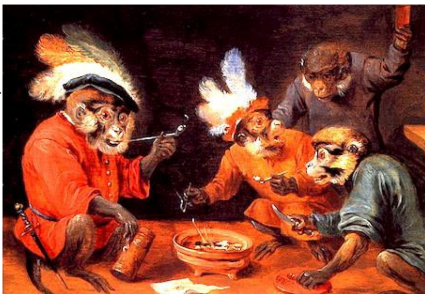
David Teniers le Jeune (Anvers, 1610-Bruxelles, 1690), Singes jouant au pocker - Vers 1660, Prado, Madrid.