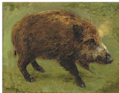
Rosa Bonheur (Bordeaux, 1822- Thomery, 1899), Le sanglier .