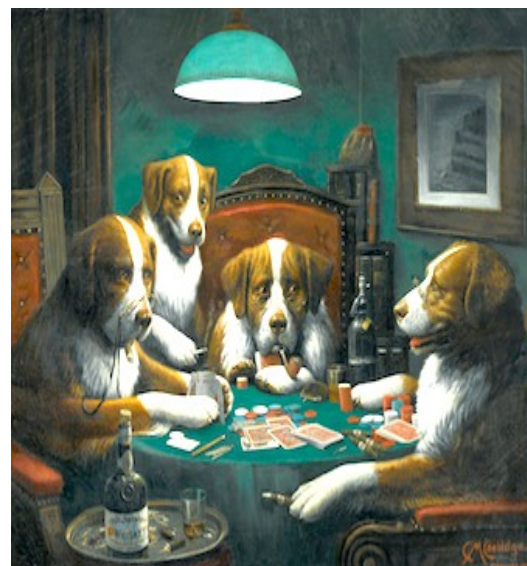
Cassius Marcellus Coolidge (Antwert 1844-New York, 1934), Chiens jouant aux cartes - 1894.