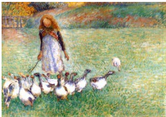
Camille Pissarro (Antilles, 1830-Paris, 1903), La petite fille gardeuse d'oies - 1886.

La scimmia (= le singe) : gridare, farfugliare, abbagliare = crier, hurler, piailler,