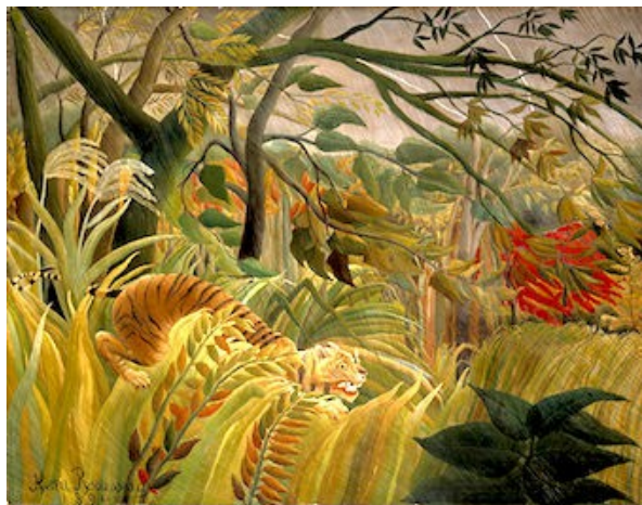
Henri Rousseau (Laval, 1844-Paris, 1910), Tigre dans une tempête - 1891, Londres.

La zebra (= le zèbre) : nitrire (nitrisce) = hennir,