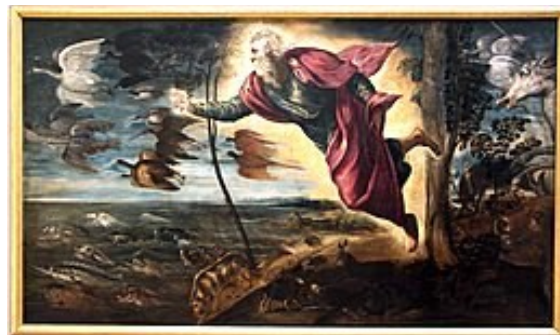
Jacopo Tintoretto (Venezia, 1518-1594), La creazione degli animali - 1550-53, Venise, Académie.