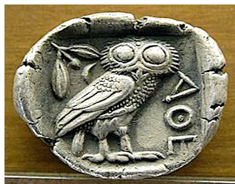
Drachme athénienne (480-420 av.J.C.) représentant la chouette d'Athéna - Lyon, Musée des Beaux-Arts.