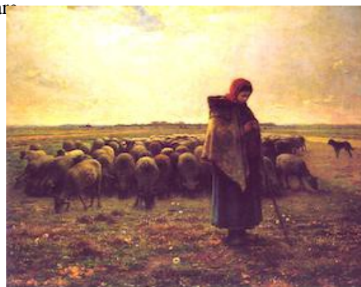
Jean-François Millet (Barbizon, 1814-1875), Bergère avec son troupeau - 1864, Musée d'Orsay, Paris.