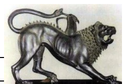
La chimère d'Arezzo

Il centauro = le centaure, mi-homme, mi-cheval, né de l'amour sacrilège d'Ixion pour Héra. Parmi les centaures, Chiron, le maître d'Achille.