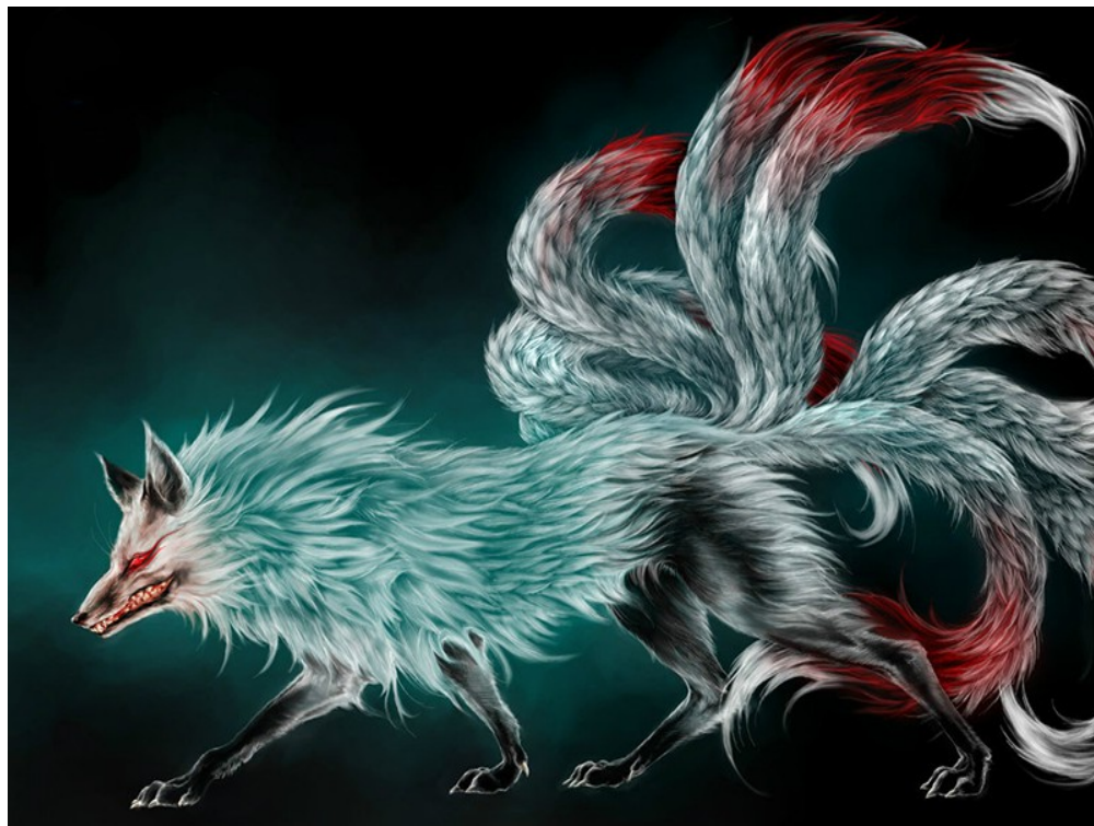
Le renard à neuf queues.