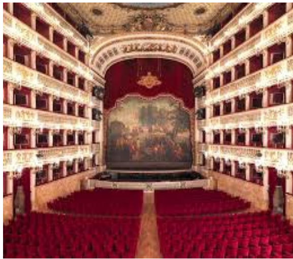
Opéra San Carlo à Naples