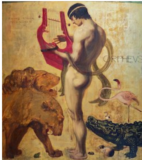
Franz von Stuck (1863-1928), Orphée charmant les bêtes sauvages - 1891, Villa Stuck