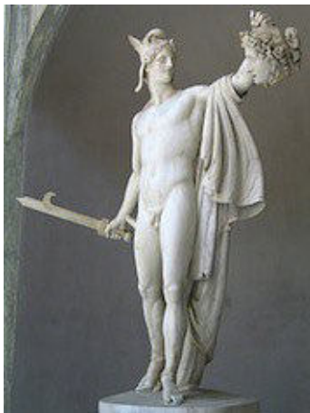
Canova Antonio , Persée triomphant , 1800-01, Roma Vaticano

Roma, 6 dicembre 1832 - Der medemo (du même).