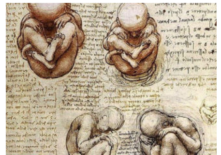
Leonardo da Vinci , dessin d'utérus avec fœtus .

L' inseminazione artificiale = l'insémination artificielle