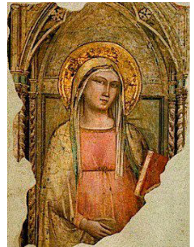
Taddeo Gaddi, Madonna del Parto , Firenze Chiesa San Francesco di Paola, XIVe siècle

Il certificato di nàscita = le certificat de naissance