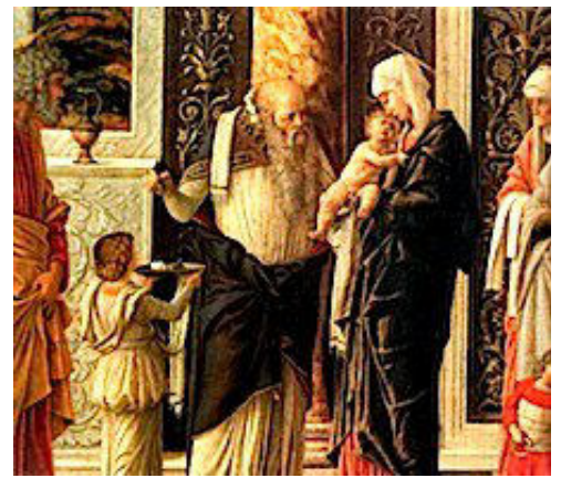
Andrea Mantegna, Circumcision du Christ, Firenze Uffizi, 1462-04

Il cerotto anticontraccettivo = le patch