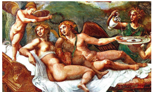
Giulio Romano, Banquet d'Amour et de Psyché , Palazzo Tè Mantova, 1532-35.