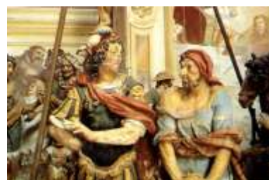
Orta, Sacro Monte, Chapelles XI, XV et XIII