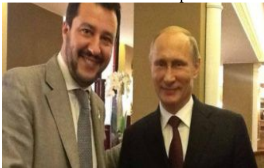
Poutine et Matteo Salvini, leader d'extrême-droite italien.

Poutine entrera-t-il dans la phase 3... ? ».