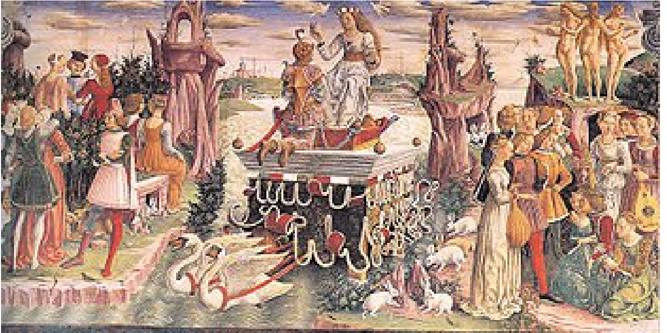
Francesco del Cossa , Avril, Triomphe de Vénus sous le signe du Taureau , Palais Schifanoia, Ferrare, 1468-1470

(Voir toutes les fresques de ce palais, actuellement en restauration, qui illustrent les signes du Zodiaque)