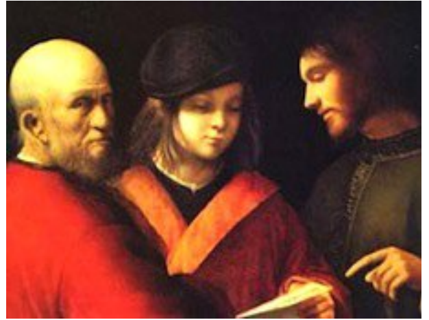
Giorgione , Les trois âges de l'homme, le vieillard, le jeune homme, l'adulte , 1500-1501, Firenze, Galleria Palatina

Le ore del mattino hanno l'oro in bocca = l'avenir appartient à qui se lève tôt