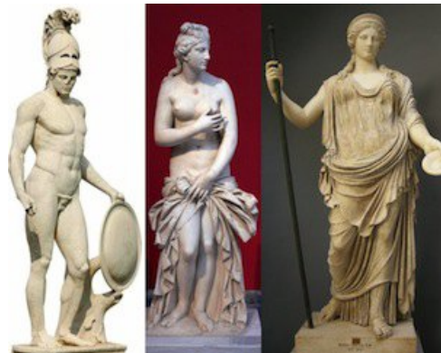
Mars, Vénus et Junon, statues antiques

Luglio = juillet, autrefois appelé Quintilis (= 5 e mois de l'année), transformé en 44 av.J.C. en honneur de Jules César