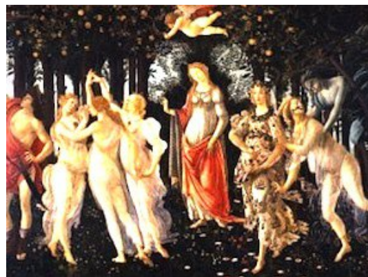
Sandro Botticelli, La Primavera , 1482, Firenze, Uffizi

L' inverno = l'hiver → invernale = hivernal