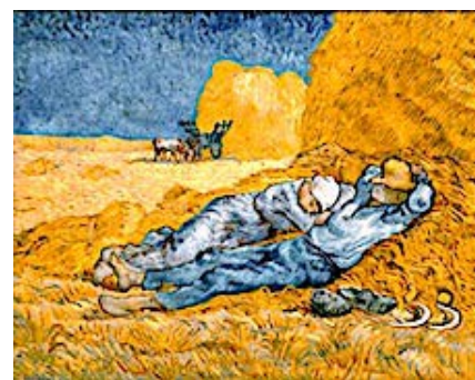
Van Gogh Vincent, Midi - Repos du travail - 1890 Musée d'Orsay.