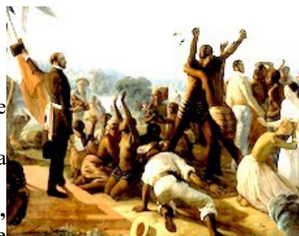
Biard François Auguste, Abolition de l'esclavage, 1848 - Versailles.

Journée d'hommage aux harkis = Giornata omaggio agli Harkis, le 25 septembre