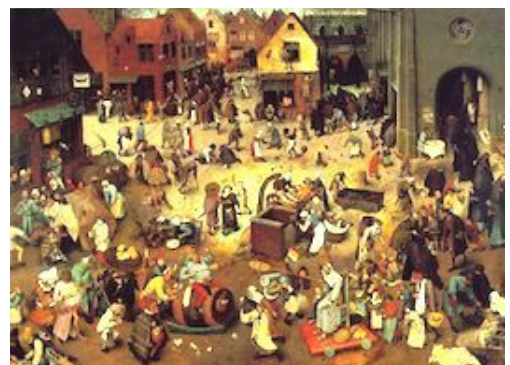
Brueghel l'Ancien, Bataille de Carnaval et de Carême - 1559 Vienne.