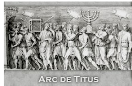
Candelabro a sette bracci dell'Arco di Tito - Roma.