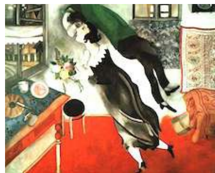
Chagall Marc, Anniversaire, 1915 - New York.

La fête de la victoire = la festa della vittoria, 8 mai