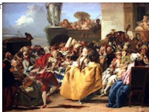
Giandomenico Tiepolo, Minuetto di Carnevale -1756, Louvre.

Festa di Santo Stefano = fête de Saint Étienne – 26 décembre (depuis la seconde Guerre Mondiale)