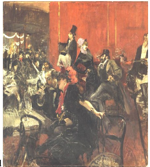
Boldini Giovanni, Scène de fête, 1889 - Musée d'Orsay.