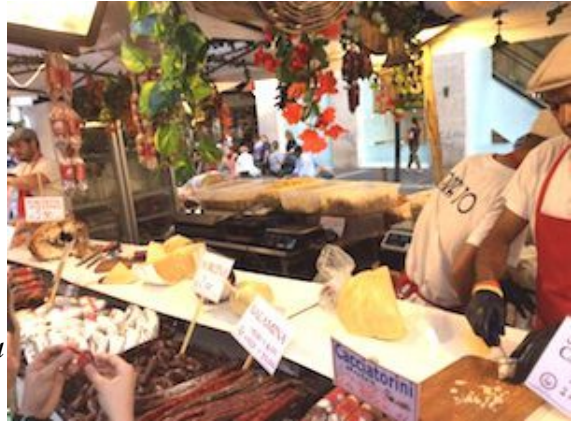
Naples - Sagra Degusta - Piazza Mercatino.

La sagra = la fête religieuse populaire avec marchés et foires < latino sacrum au féminin : à Rome, célébration d'un lieu de culte ou d'une divinité suivie de processions et de banquets. À partir du christianisme, ces fêtes sont consacrées aux saints et à la consécration d'un lieu de culte ou aux événements de la vie paysanne, récoltes, grands produits locaux (raisin, vin, viande, poisson, etc.) Indique aussi le sacre, Cf. Carducci , La sacra di Enrico Quinto (Giambi ed epodi) ; Stravinsky , La sagra della primavera (ballet) = le sacre du printemps