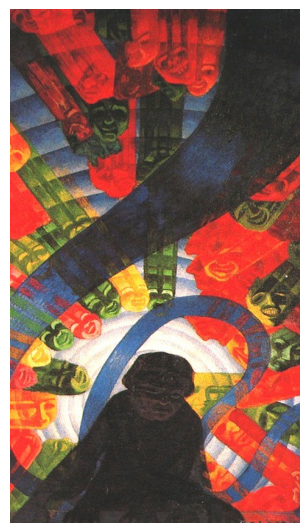
Russolo Luigi, La musica, un pianista di fronte al suo pubblico - 1911 Royaume Uni.